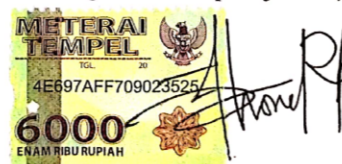
Ivone Cecilia Rompas

Surabaya, 12 April 2019 Yang membuat pernyataan,